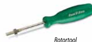
Роторы Серии 5000