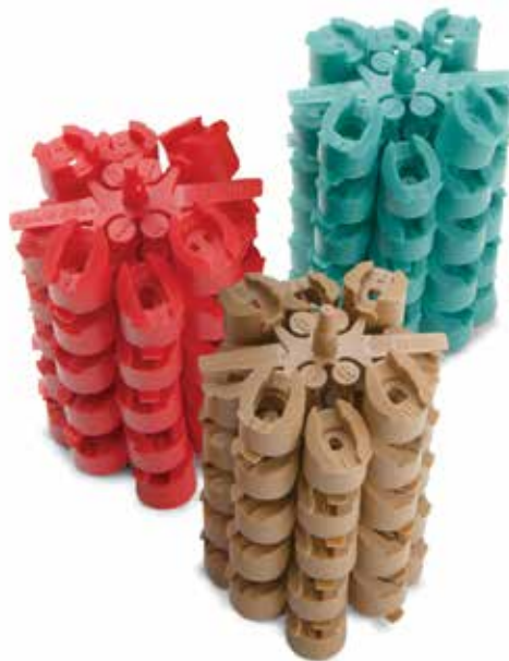
Форсунки MPR для роторов 5000 серии