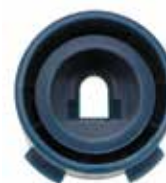
Форсунка Rain Curtain, вид сзади