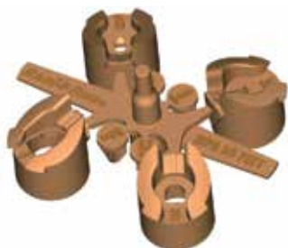
Мини-комплект на четыре форсунки

5000MPR: упаковка, содержащая 30 комплектов форсунок 5000-MPR: 10 шт. 5000-MPR-25, 10 шт. 5000-MPR-30 и 10 шт. 5000-MPR-35