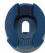
Форсунка Rain Curtain, вид спереди